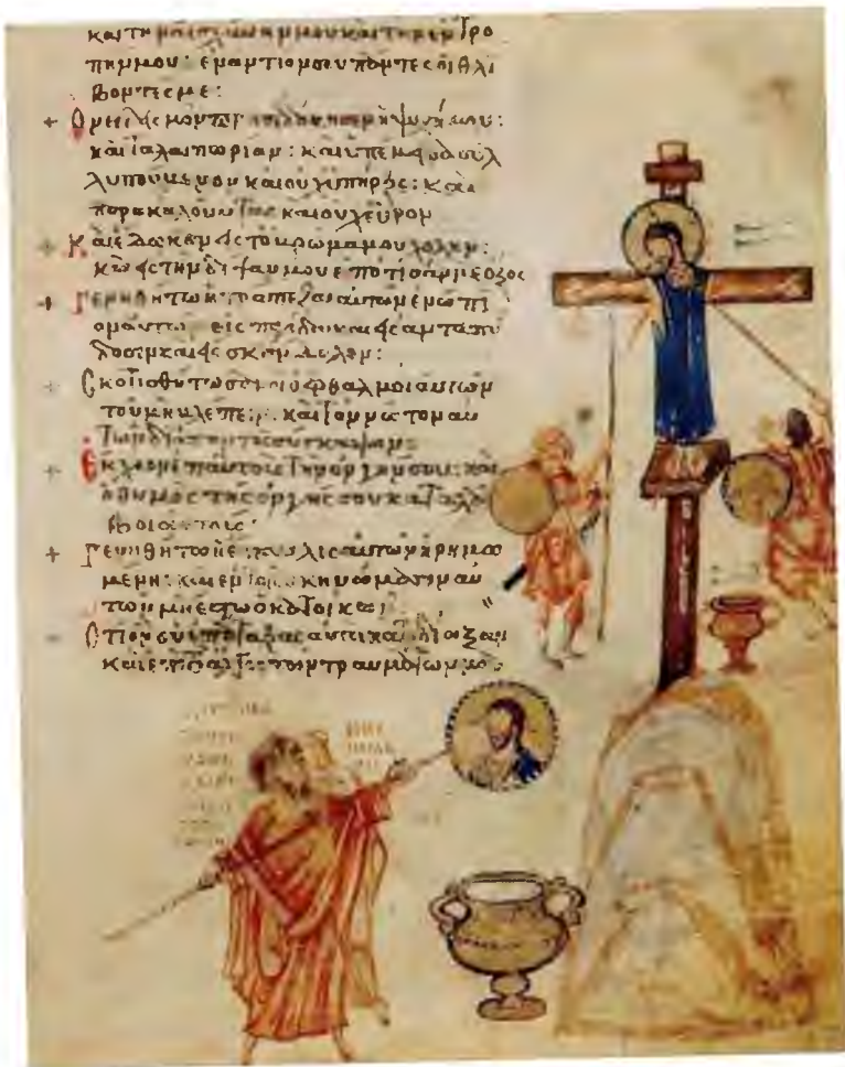
Худовская Псалтирь (первая половина IX в.)