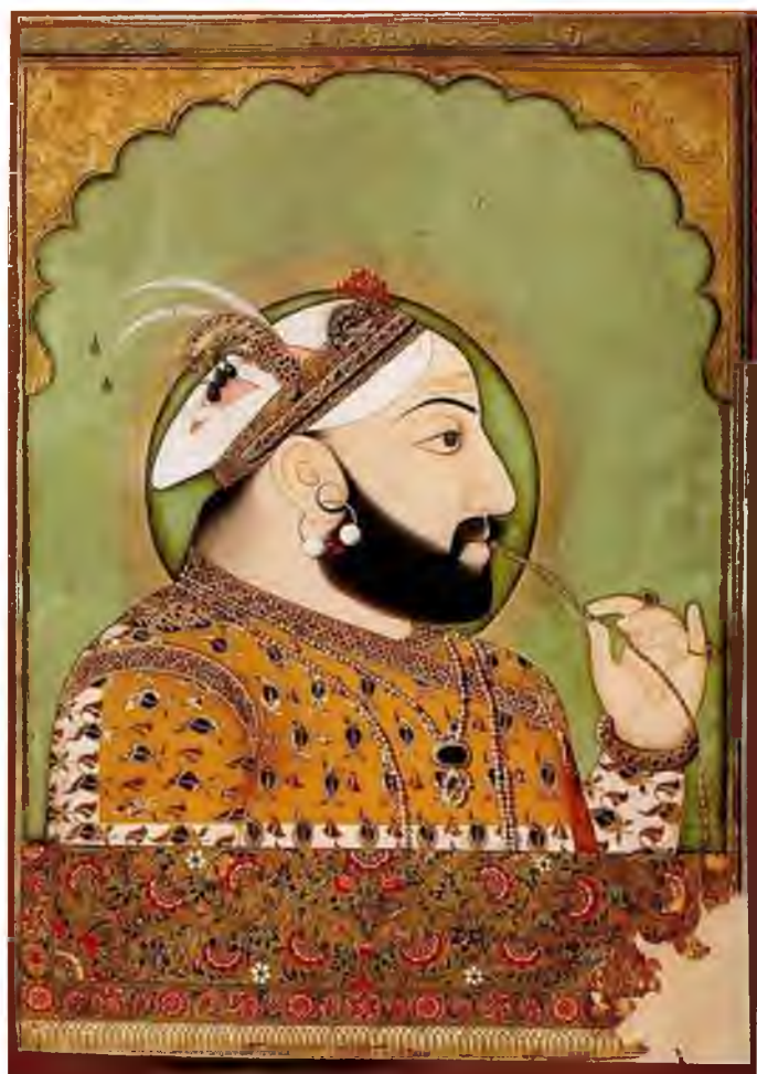
Портрет Санграм Сингха II. Удайпур, 1725-35гг.